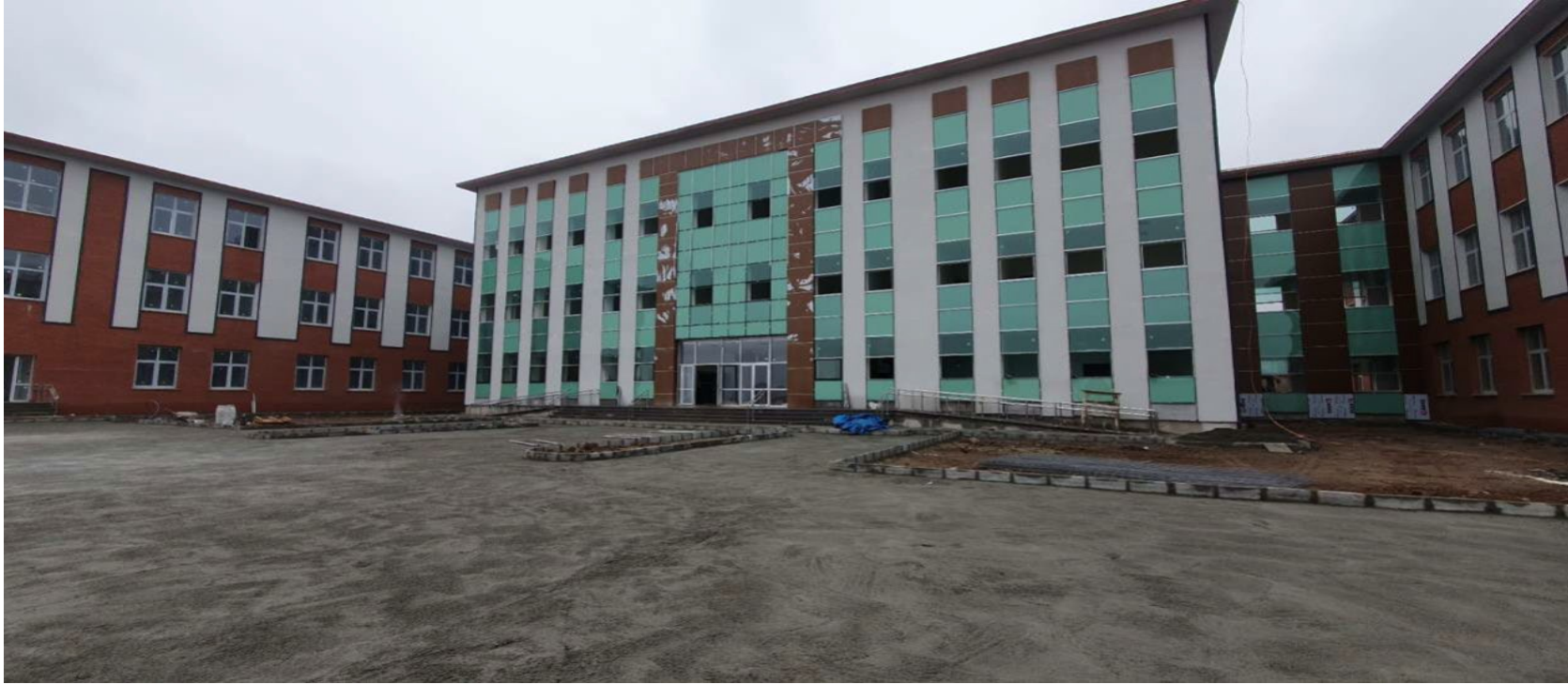
Merkezi Derslik Binası